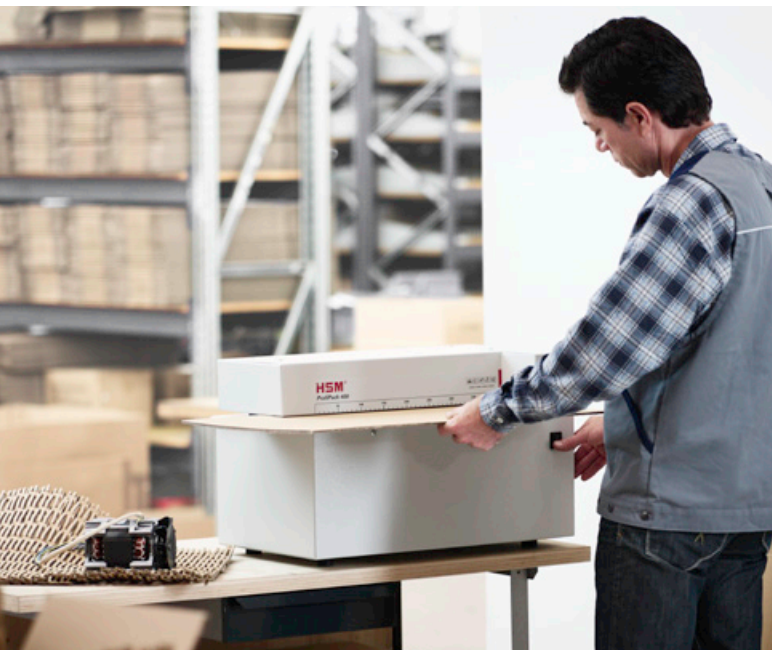
HSM ProfiPack 400