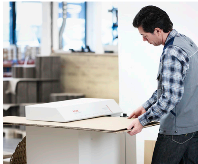
HSM ProfiPack 425