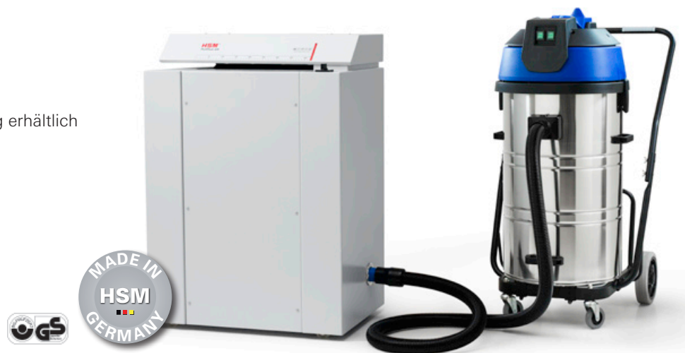
ProfiPack 425 Auch mit Absaugung erhältlich